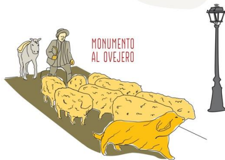
MONUMENTO AL OVEJERO