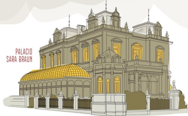
PALACIO SARA BRAUN