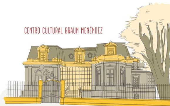
CENTRO CULTURAL BRAUN MENÉNDEZ