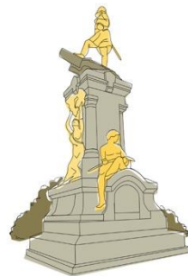
MONUMENTO A MAGALLANES