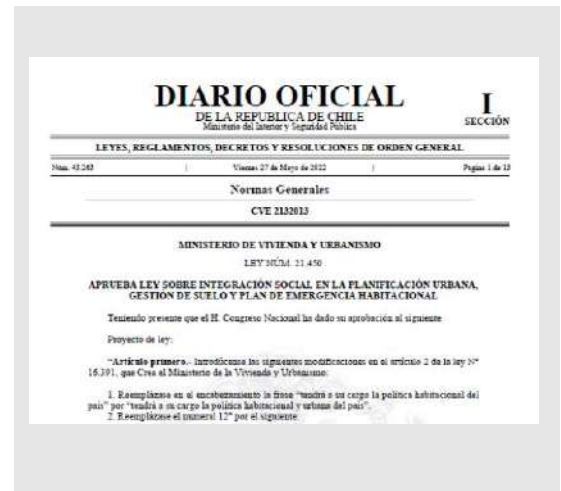
Imagen: Diario Oficial, 27 de mayo de 2022.

Fecha: Diario Oficial, 27 de mayo de 2022.