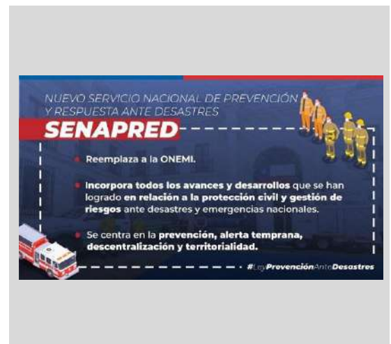
Imagen: ONEMI, 2021.

Fecha: Diario Oficial, 07 de agosto 2021.