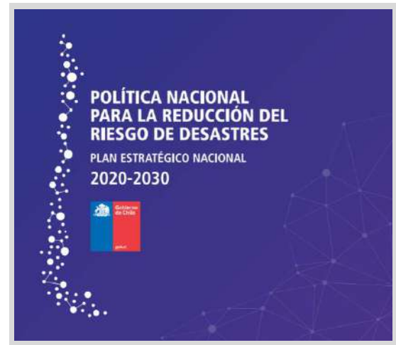
Imagen: ONEMI, 25 de abril de 2021.

Fecha: Diario Oficial, 17 de abril de 2021.