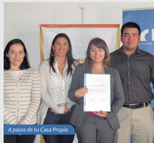
A pasos de tu Casa Propia.