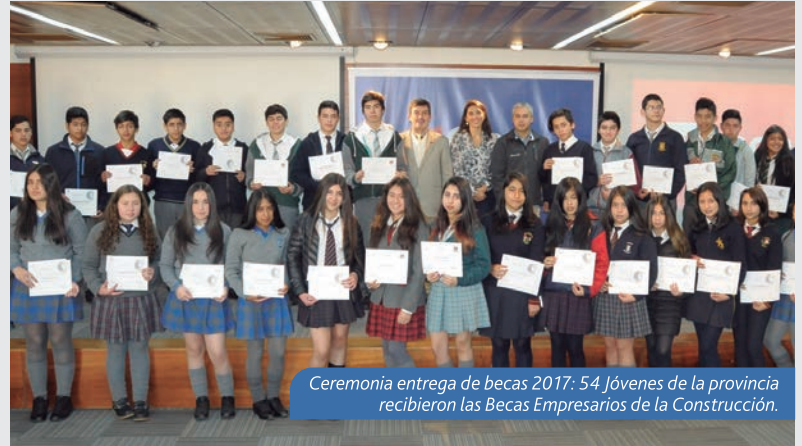
Ceremonia entrega de becas 2017: 54 Jóvenes de la provincia recibieron las Becas Empresarios de la Construcción.

Con una inversión que superará los 300 millones de pesos en Los Ángeles, la Cámara Chilena de la Construcción, espera beneficiar a más de 4 mil trabajadores y sus familias en la ciudad con programas sociales en las áreas de salud, vivienda, formación y bienestar. De esta forma, el gremio de la construcción, vela por el cuidado y calidad de vida de sus colaboradores quienes acceden a capacitaciones, atenciones en terreno, espectáculos deportivos y culturales, entre otros ■