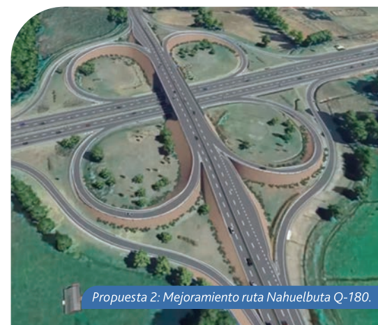
Propuesta 2: Mejoramiento ruta Nahuelbuta Q-180.

En esta misma línea, el Presidente señala que "Los habitantes de las comunas cordilleranas de la provincia