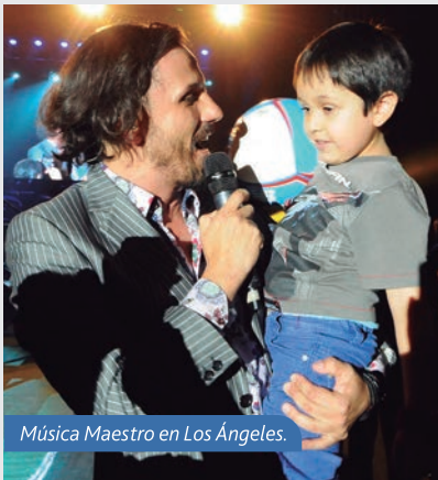
Música Maestro en Los Ángeles.