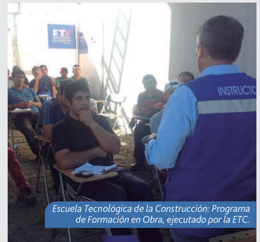
Escuela Tecnológica de la Construcción: Programa de Formación en Obra, ejecutado por la ETC.