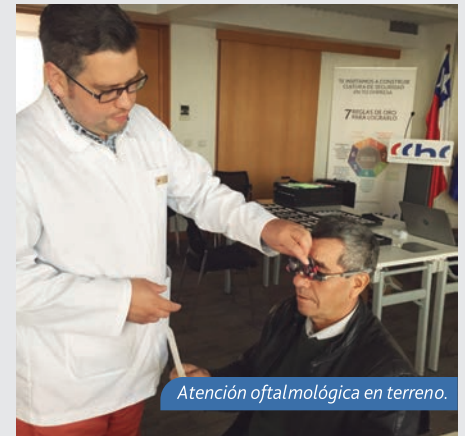
Atención oftalmológica en terreno.