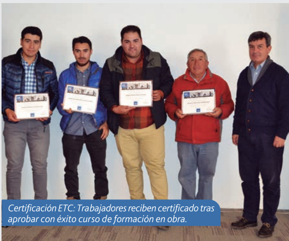
Certificación ETC: Trabajadores reciben certificado tras aprobar con éxito curso de formación en obra.