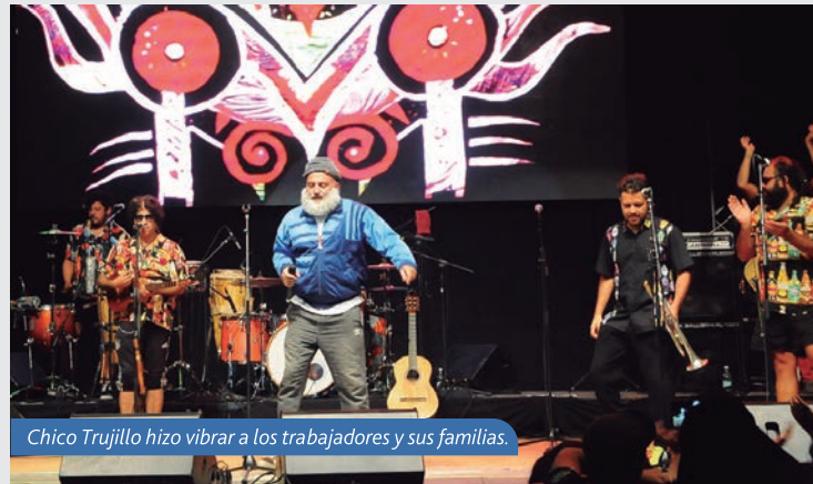
Chico Trujillo hizo vibrar a los trabajadores y sus familias.