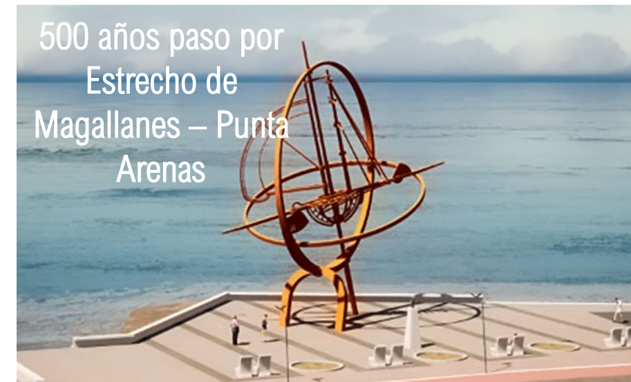
500 años paso por Estrecho de Magallanes – Punta Arenas