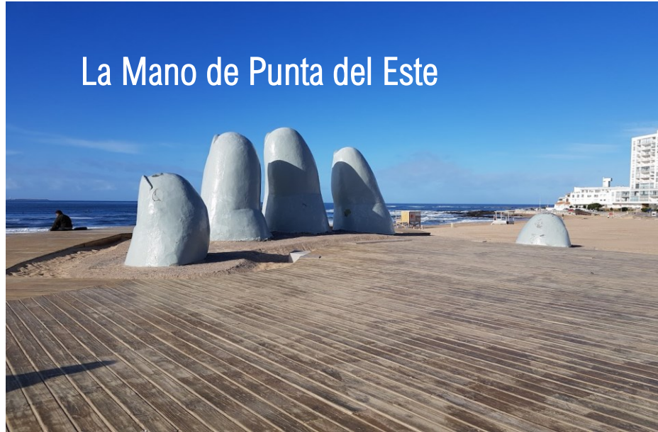
La Mano de Punta del Este