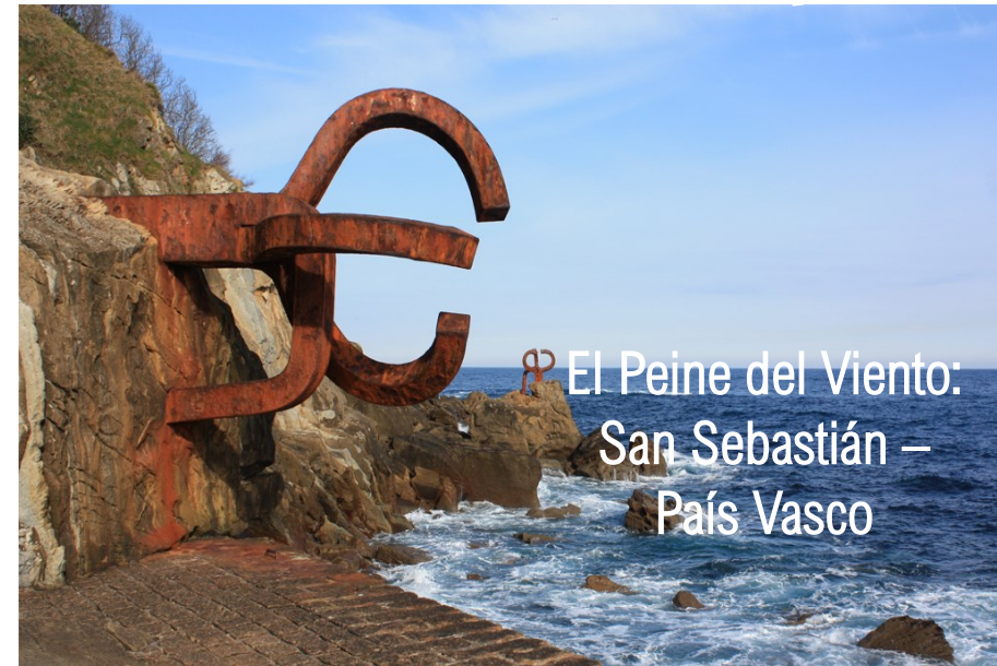
El Peine del Viento: San Sebastián – País Vasco